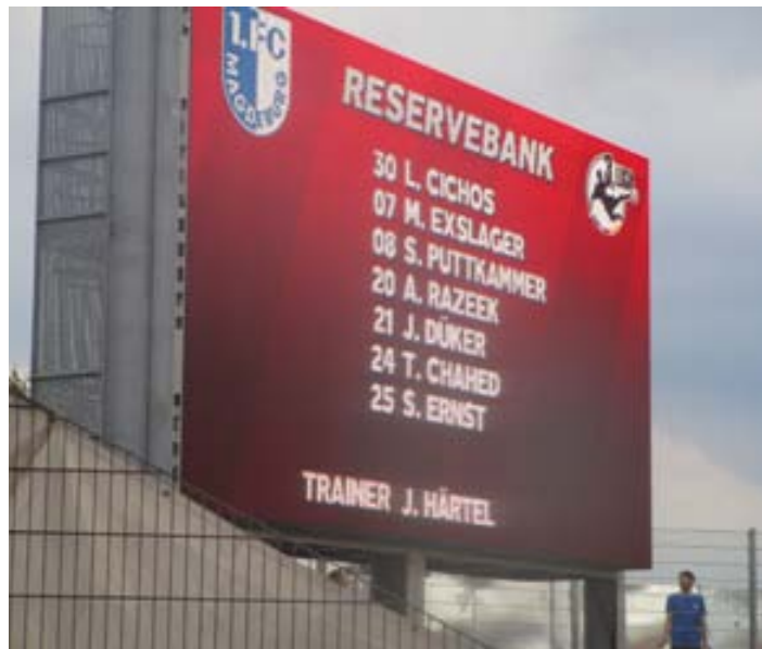
Die FCM-Auswechselbank in Zwickau.