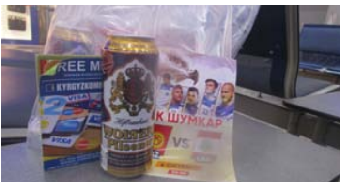
Eine bunte Tüte aus dem Duty Free.

Nervlich ziemlich fertig also bei den Trierer Kumpels auf der Tribüne platzgenommen und nach einer Bierrunde zur Beruhigung gefragt. Betretene Blicke – es gäbe leider keines im Stadion war die Antwort, Vorgabe der UEFA. Wie die Reaktion ausfiel, als ich daraufhin in meiner Tasche kramte und den überraschten Trierern die Wolters-Dosen präsentierte, kann sich jeder vorstellen. Dosen, gekauft in Bishkek, so halbwegs geschmuggelt durch Istanbul und getrunken bei Luxemburg vs Schweden. Wo just kurz danach Christoffer Nyman auf schwedischer Seite eingewechselt wurde. Wohl bekomm's!