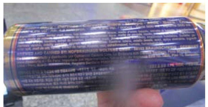
Wolters in Kirgistan.