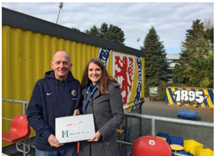
Spendenübergabe der HELIOS Klinik an Lernort Stadion.